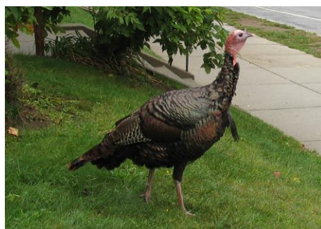
Obrázok č. 1